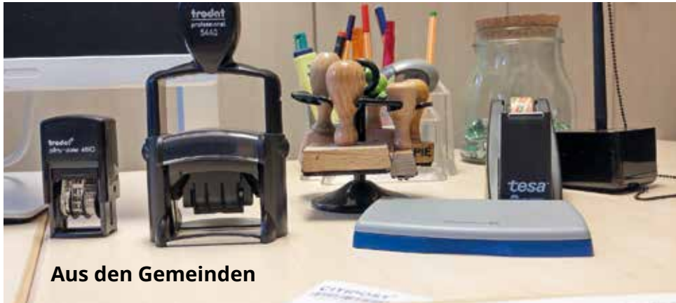
Aus den Gemeinden