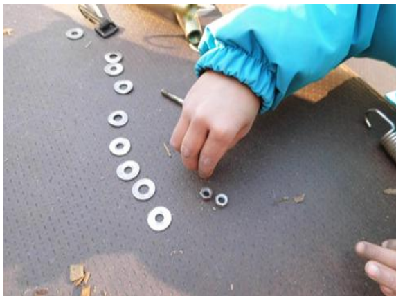
Kind 3,6 Jahre alt

Im Freispiel lernen die Kinder sich in andere Kinder hineinzusetzen, Situationen einzuordnen und zu durchschauen, Lösungen für Probleme zu finden und Materialien und Situationen durch eigene Ideen zu verändern. Die Kinder lernen Vorgänge zu planen und durchzuführen, sie lernen sich zu konzentrieren, ihre Phantasie einzusetzen und mit anderen zusammen zu arbeiten. Darum lassen wir die Kinder nach individuellen Bedürfnissen und orientiert am jeweiligen Entwicklungsstand entscheiden, welchen Bereich sie für ihr Spiel bevorzugen.