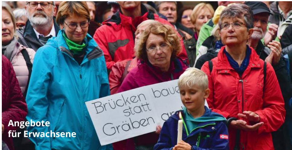
Angebote für Erwachsene