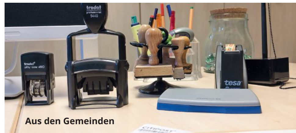
Aus den Gemeinden